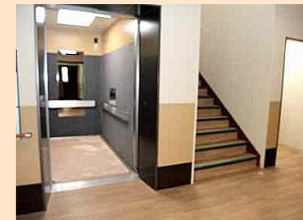
＜エレベーターホール＞